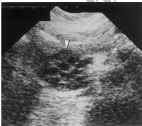
شکل ۲ - نمای سونوگرافی از کیست هیداتید پانکراس

پانکراس ۱/۵۱ درصد و بیشتر موارد در زنان بوده است. (۱۵) در گزارش کشور رومانی، شیوع کیست هیداتید ۰/۵ تا ۳ درصد گزارش شده است. (۱۶) در عربستان ۱ درصد، (۵) کویت ۰/۲۵ درصد، (۱۴) در یونان ۱/۵ درصد، (۱۷) ایتالیا ۱ درصد (۶) موارد بیماری کیست هیداتید مربوط به پانکراس می باشد. در متون علمی ۰/۲ تا ۲ درصد موارد بیماری کیست هیداتید در پانکراس دیده می شود.